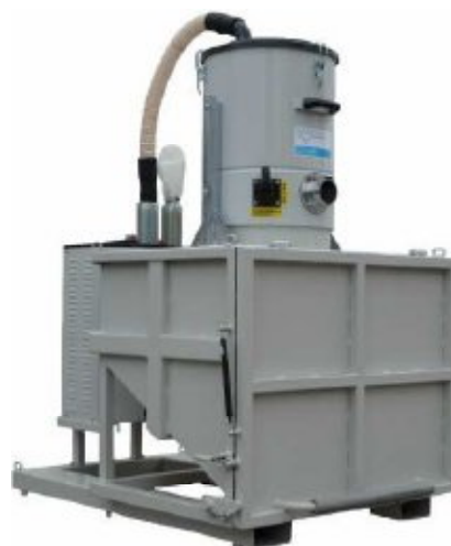
Châssis mobile avec 4 roues