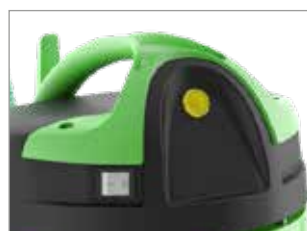
TÉMOIN LUMINEUX SAC PLEIN