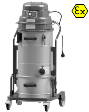
Cuve et chambre de filtration en inox inclus